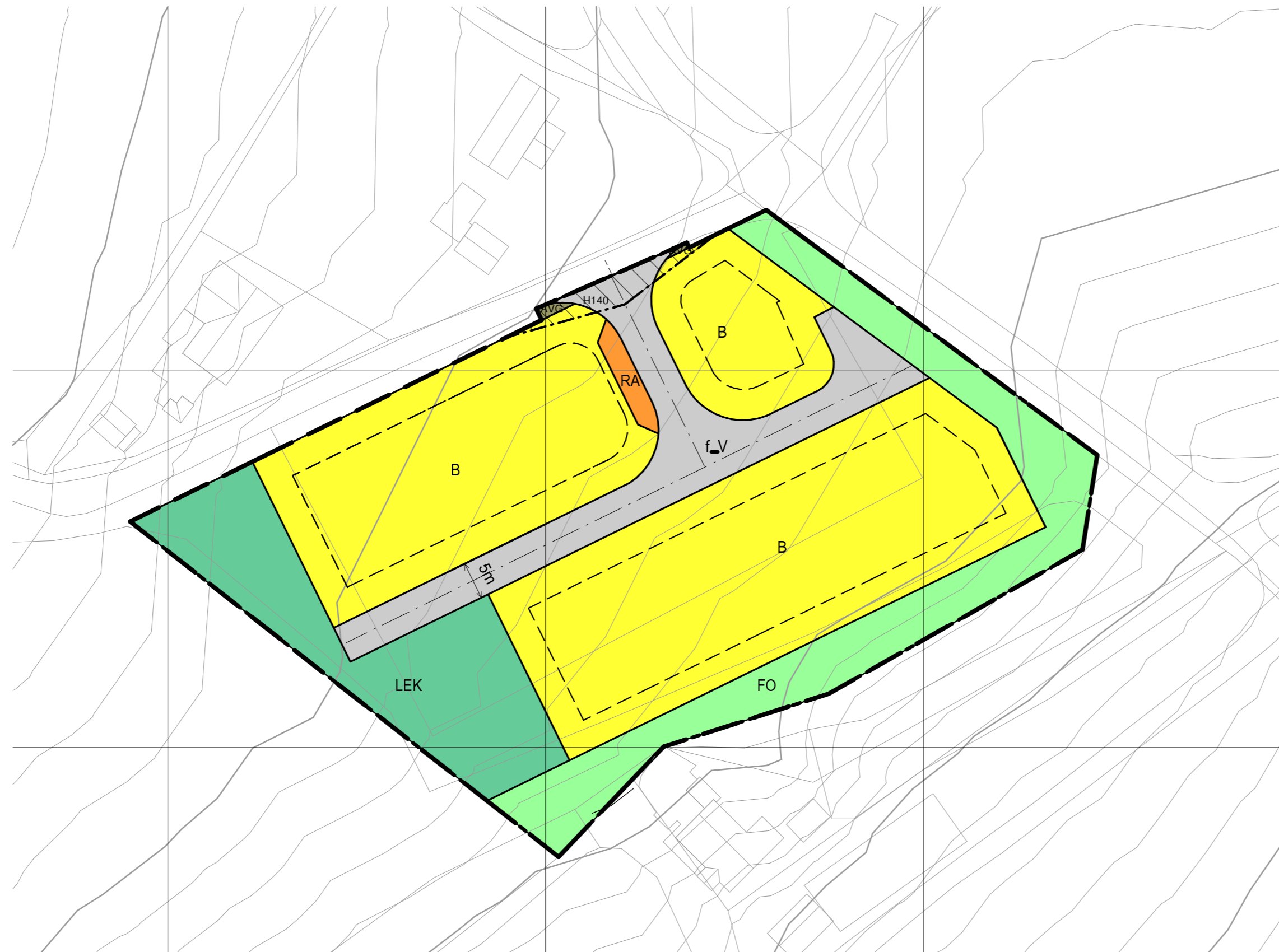
Arealplan 1 : 500